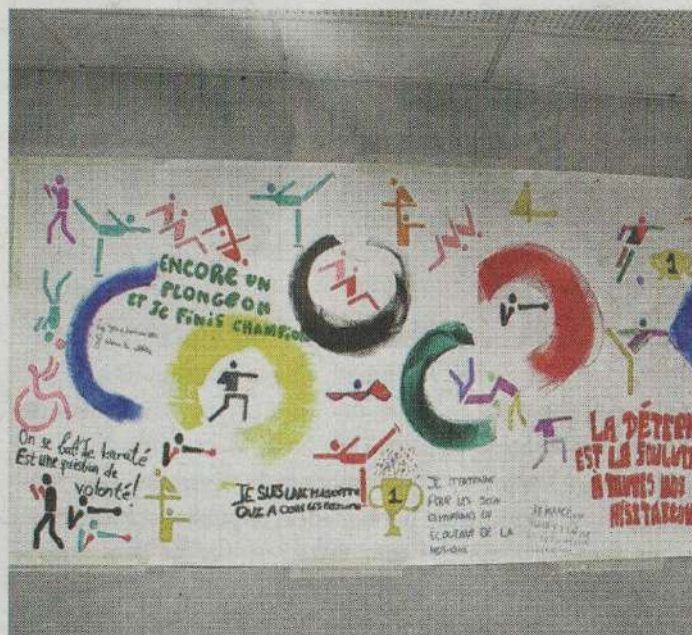
Une partie de la fresque exposée dans un couloir du gymnase.

C'est un tableau itinérant, plein de vie, qui constitue un trait d'union entre les habitants de tous âges des communes situées sur le territoire rural du Vexin. Cette action a été réalisée en partenariat avec la Communauté de communes Vexin-Val de Seine, le Conseil départemental du Val-d'Oise, la Région Île-de-France et la Caf du Val-d'Oise, sur une initiative de Pile poil et Cie.