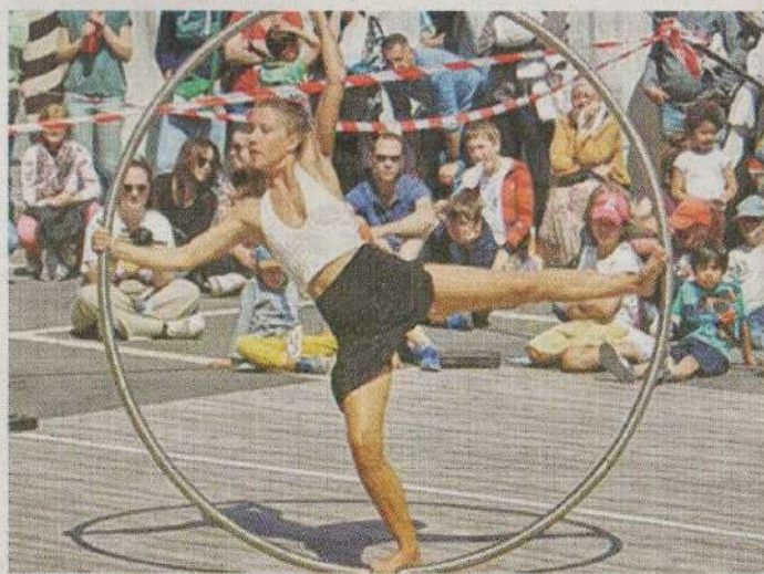
Les animations auront lieu lors des olympiades culturelles au Vexin.

Omerville accueille la Compagnie Pile Poil et Compagnie pour une journée entière de spectacles professionnels, d'ateliers et d'animations gratuits et ouverts à tous, sur le thème du sport et de la santé, ainsi que des